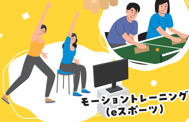
モーショントレーニング (eスポーツ)